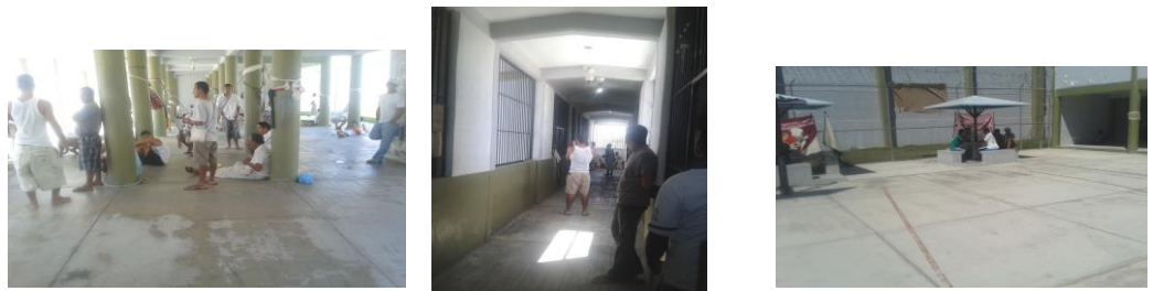
(Área de dormitorios a la cual estaba asignado el agraviado VI ).

Cabe destacar que el artículo 43 del Reglamento Interior de la Cárcel Pública del Municipio de Bahía de Banderas, Nayarit , señala que las personas detenidas a su ingreso se le ubicara en el área de infractores, siempre y cuando su aseguramiento haya sido realizado por la comisión de algún delito, lugar en donde permanecerá hasta que se le consigné por la autoridad ministerial ante la autoridad judicial, y es hasta ese momento cuando se le podrá ubicar en el área de procesados de esa cárcel.