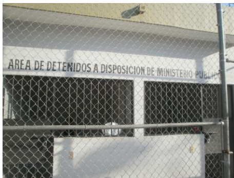
ÁREA DE PERSONAS PUESTAS A DISPOSICIÓN DEL MINISTERIO PÚBLICO.

De manera grafica, se muestra el área específica en donde, por su situación jurídica, debieron estar asignados P1 y P2 ; asimismo, donde se muestra que estas instalaciones se encuentra debidamente delimitadas por barras de contención y malla ciclónica que prohíbe a las personas afincadas a ellas el acceso a otras áreas del centro de reclusión.