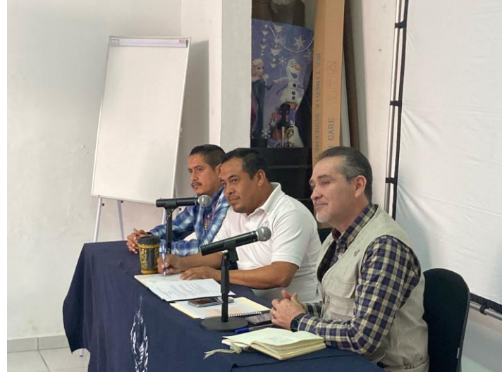
Reunión previa, 08 febrero 2023