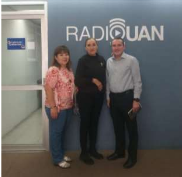
Grabación del Programa de Radio “Radio UAN. Elemento Universitario” 101.1 FM 03 de mayo del 2023