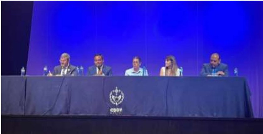
Panel: “Retos de las defensorías públicas de derechos humanos en América”.